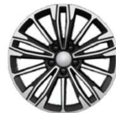
18" құйма дискілері