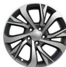
17" құйма дискілер